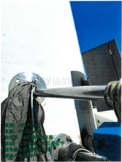
有组织废气采样照片