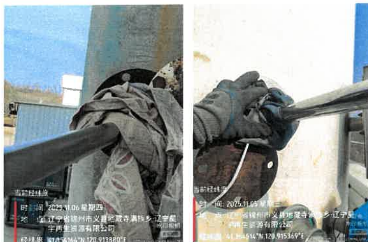
无组织废气采样照片